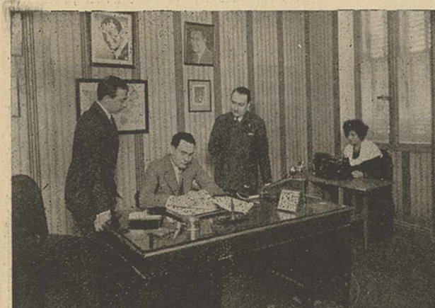
L'Agence Paramount de Marseille à gauche : le bureau de M. Lenglet à droite : la vérification

Imp. GIRAUD-320; Ch. de la Nerthe, L'Estaque