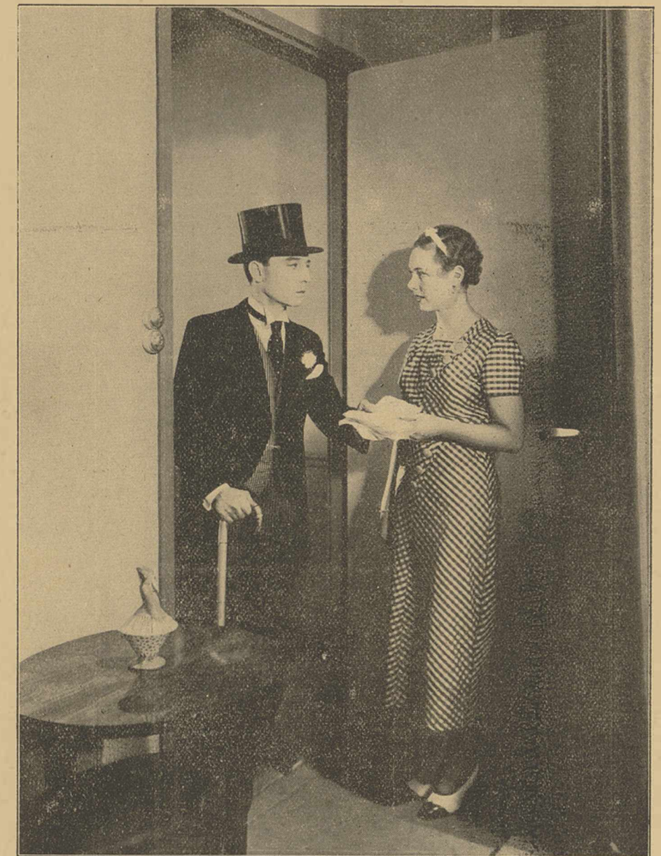
La délicieuse PAULETTE DUBOST et BUSTER KEATON dans « LE ROI DES CHAMPS ELYSÉES » Production NÉRO-FILM Distribué par PARAMOUNT

Voici venir à nouveau La Veuve Joyeuse . Répétons les mots d'un grand critique : « C'est un vieux vin précieux dans une coupe neuve ».