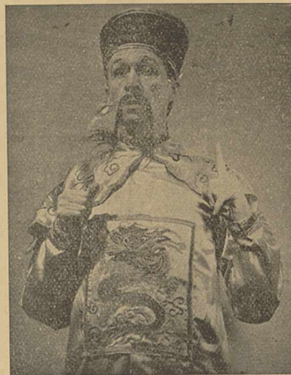
ARMAND BERNARD dans « L'ONCLE de PEKIN » qui sort cette semaine au RIALTO (Luna Film)

Nous apprenons la création d'une nouvelle société de distribution de films : la Société « Les Films Cristal », dont le siège social est fixé à Paris, 4, rue Balny-d'Avricourt, et