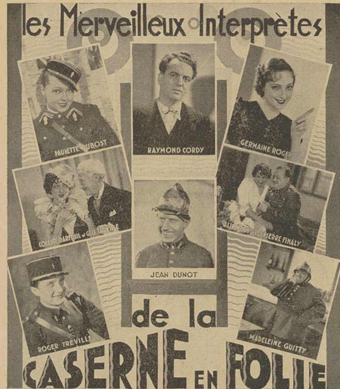
Réalisation de Maurice CAMMAGE (FILM MERIC)

Impr. Cinématographique, 49, Rue Edmond-Rostand - Marseille.