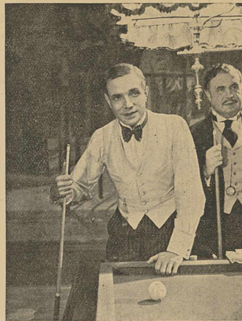
Pierre RICHARD-WILLM et Roger KARL dans "BARCAROLE" (A.C.E.)

PALACE. — Le Grand Jeu , un film signé Jacques Feyder, qui est loin de démentir les hautes qualités de son auteur. Le scénario