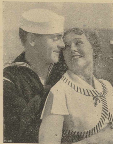
Une scène de "VOILA LA MARINE" (Warner Bros)