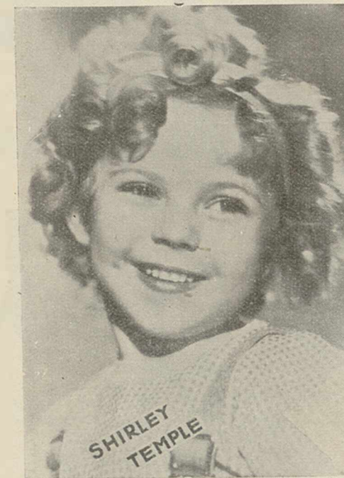
SHIRLEY TEMPLE, dont nous allons voir mardi prochain le dernier film Tchin-Tchin (Fox).

Aussi, vous ne nous en voudrez pas, chers lecteurs et an-