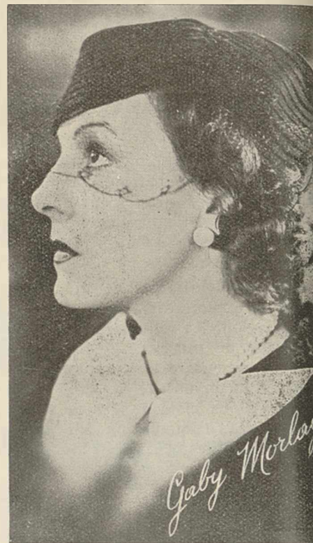
GABY MORLAY qui interprète "LE MESSENGER" aux côtés de JEAN GABIN Pathé-Consortium

Il convient de féliciter M. d'Aguiar pour cette brillante initiative qui ajoutera encore au succès de deux productions particulièrement commerciales.