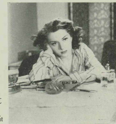
Viviane ROMANCE vedette de La Tradition de Minuit